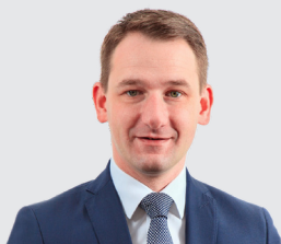
Johannes Maciejonczyk 1. Bürgermeister Markt Burgebrach

Die genaueren Hinweise zu allen Veranstaltungen werden in den kommenden Wochen veröffentlicht. Bitte beachten Sie die entsprechenden Hinweise. Wir freuen uns nach der arbeitsintensiven Zeit der Umsetzung nun den erfolgreichen Abschluss dieser Maßnahmen gemeinsam mit Ihnen feiern zu können. Sie sind herzlich eingeladen!