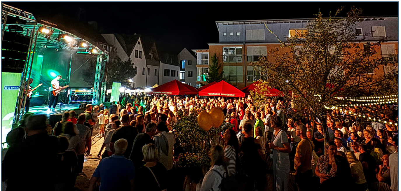
Ein fantastisches Wochenende in Burgebrach.