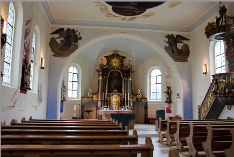
Kuratiekirche "Heilige Schutzengel" in Stappenbach

Nähere Informationen zu deren Geschichte erhalten Sie auf der Internetseite der Pfarrei Burgebrach: www.pfarrei-burgebrach.de