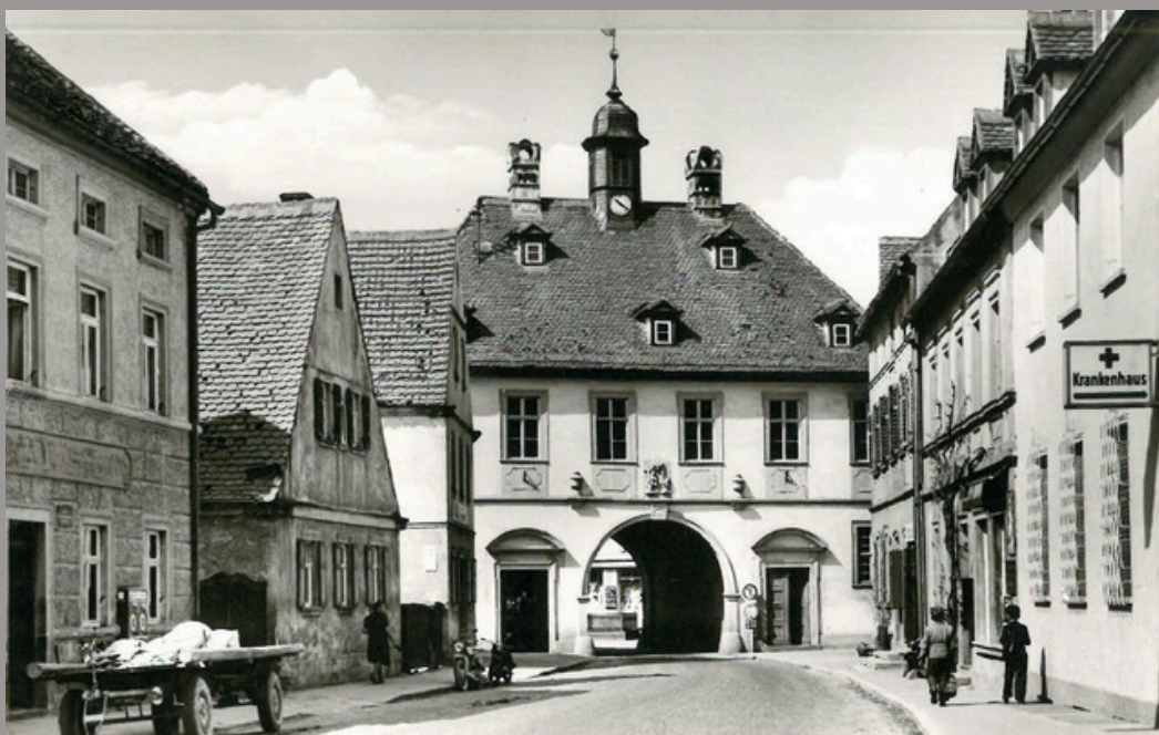
Altes Rathaus - Erbaut 1720 - einst "Oberes Tor"

Dabei wird Ihnen die sagenumwobene Ursula v. Windeck ebenso begegnen wie die mildtätigen Niederbronner Schwestern. Das historische Rathaus samt seiner Toranlage vermittelt einen Eindruck von der Wehrhaftigkeit des Ortes im Mittelalter. Die tiefe Verwurzelung im christlichen Glauben stellt unsere Pfarrkirche St. Vitus sowie das Pfarrhaus im Herzen des Ortskerns unter Beweis.