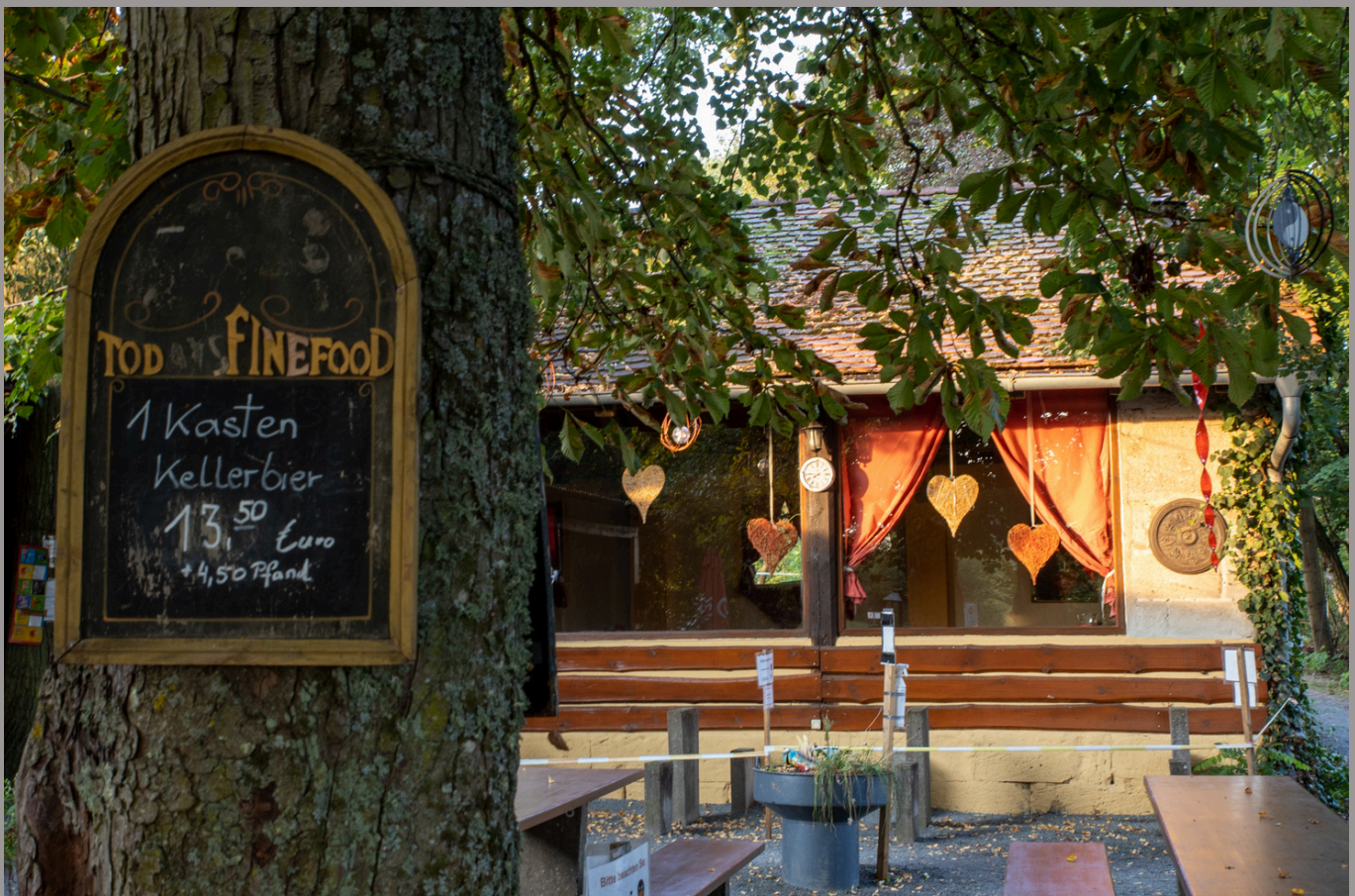
Unter den Bäumen lässt es sich aushalten auf dem Schwana-Keller in Burgebrach

Durch eine Lagerung bei kühlen Temperaturen kann die Haltbarkeit eines Bieres verlängert werden. Vor der Anwendung technischer Kühlanlagen verfügten die meisten Brauereien und Bierlokale deshalb über große Bierkeller. In Franken sind auch heute noch viele Bierkeller in Betrieb. Meist ist über dem Keller ein Schankbetrieb errichtet worden - daraus entstand die Redewendung "auf den Keller gehen". Auf einem typisch fränkischen Bierkeller genießt man sein Bier und seine Brotzeit meist unter altem Baumbestand aus Eichen, Linden oder Buchen.